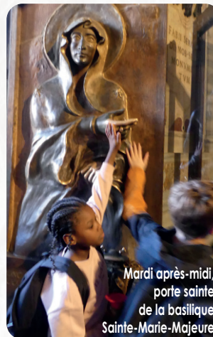
Mardi après-midi, porte sainte de la basilique Sainte-Marie-Majeure

cette journée par une messe à Sainte-Marie-des-Anges, pour rendre grâce pour ces moments inoubliables. Le retour dans la nuit en direction de l'Alsace fut un moment de réflexion et de partage sur la richesse spirituelle et humaine de ce voyage, mais aussi l'occasion d'un repos bien mérité (surtout pour nos pieds !).