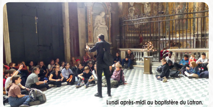
Lundi après-midi au baptistère du Latran.

Les jours suivants, avec nos chaussures de marche, nous avons arpenté les rues bondées et visité les symboles les plus marquants de la Rome antique tels que le Capitole, cœur de l'empire romain, la basilique Saint-Clément avec ses mystérieux sous-sols et le Colisée, témoin de siècles de civilisation et de luttes. Chaque pierre semblait raconter l'histoire de l'empire romain et des premières communautés chrétiennes. Mais Rome, c'est aussi son rôle de sanctuaire chrétien, avec ses basiliques majestueuses : Saint-Jean-de-Latran et son baptistère, la basilique Sainte-Marie-Majeure, la basilique du Latran Saint-Paul-hors-les-Murs et la basilique Saint-Pierre, des lieux sacrés qui nourrissent