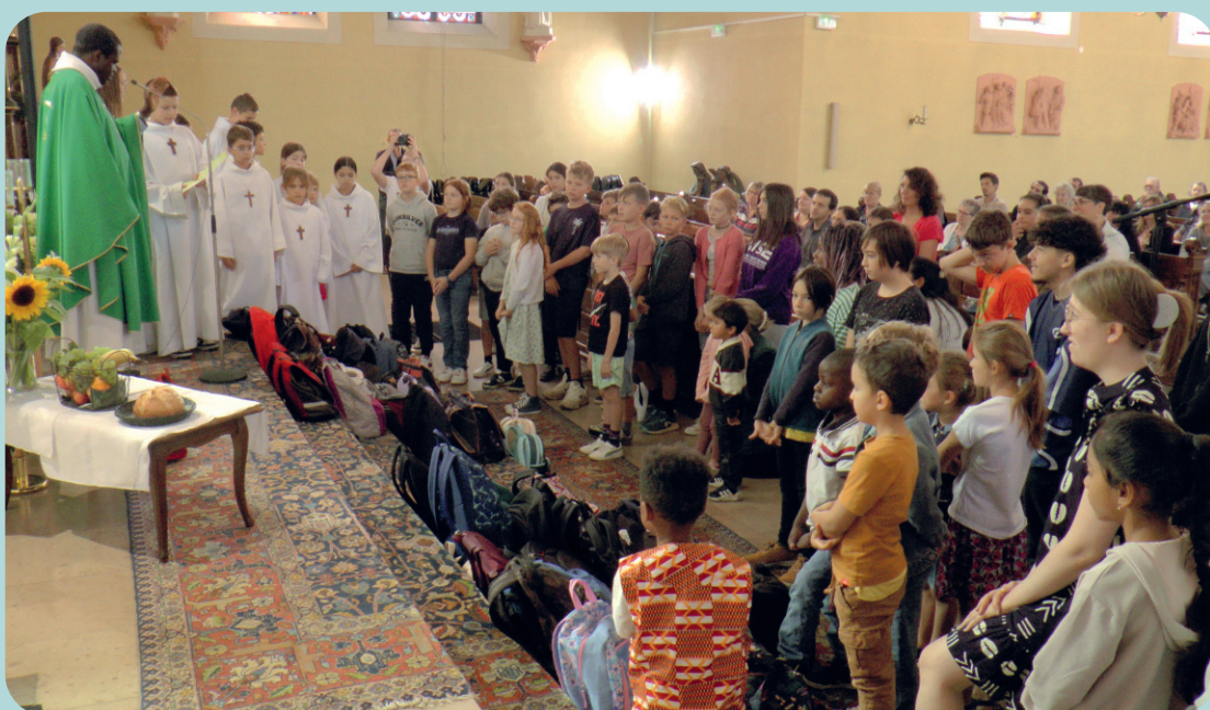
La messe de rentrée des enfants et jeunes a été marquée par la traditionnelle bénédiction des cartables.