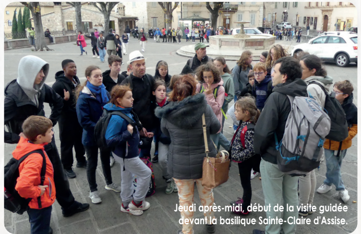
Jeudi après-midi, début de la visite guidée devant la basilique Sainte-Claire d'Assise.

cette journée par une messe à Sainte-Marie-des-Anges, pour rendre grâce pour ces moments inoubliables. Le retour dans la nuit en direction de l'Alsace fut un moment de réflexion et de partage sur la richesse spirituelle et humaine de ce voyage, mais aussi l'occasion d'un repos bien mérité (surtout pour nos pieds !).