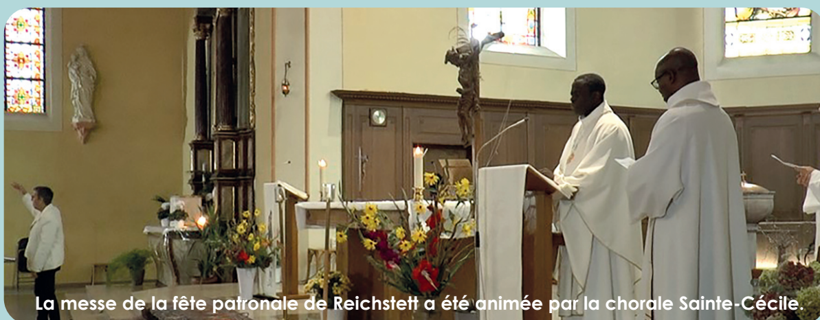
La messe de la fête patronale de Reichstett a été animée par la chorale Sainte-Cécile.