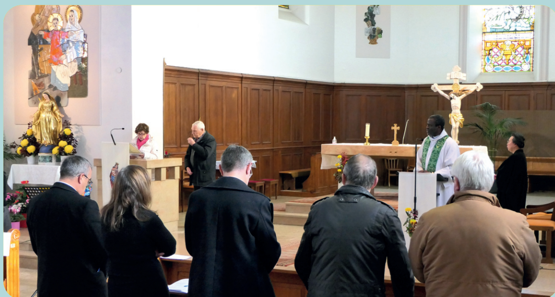
Les chorales Saint-Luc et Sainte-Cécile ont animé la célébration oecuménique pour la paix du 11 novembre à Souffelweyersheim. Elles sont dans la foulée intervenues à la cérémonie au monument aux morts organisée par la municipalité.