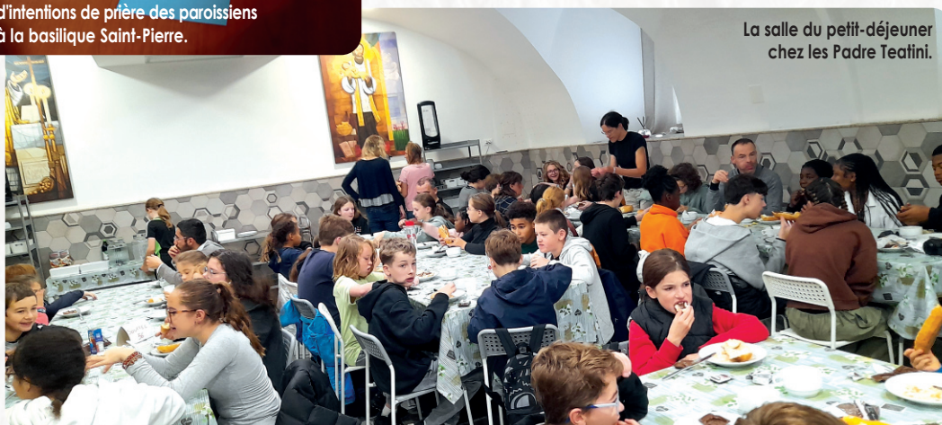
La salle du petit-déjeuner chez les Padre Teatini.