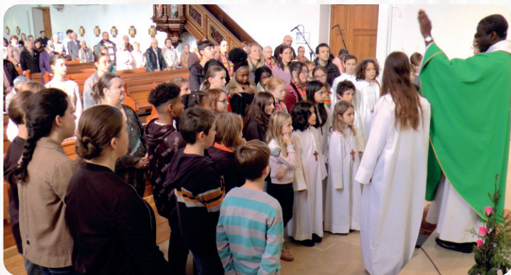
La messe des familles du 12 octobre à Souffelweyersheim, animée comme d'habitude par la chorale D'Hartzengele, a été l'occasion de bénir les pèlerins en instance de départ.

l'âme et renforcent la foi, où nous avons eu le privilège de franchir les quatre portes saintes, l'année étant jubilaire. Nous nous sommes aussi recueillis sur les tombes de plusieurs papes, saintes et saints. Nous avons exploré les catacombes, lieux de recueillement et de mémoire, où nous avons vécu un moment intense de prière suivi d'une messe avec une profonde spiritualité, renforçant notre unité en tant que groupe. Puis, sortant des ombres de l'histoire chrétienne, nous avons fait une halte à la célèbre fontaine de Trévi, où il est impossible de résister à l'envie de jeter une pièce en espérant que ses vœux soient exaucés. Un geste ancré dans la tradition, mais aussi un symbole de notre espoir et de nos prières murmurées au fil de notre voyage.