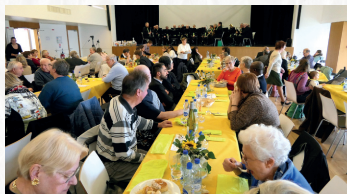
Le bilan de la kermesse du 9 novembre dernier au profit de la rénovation du foyer et de l'église Saint-Michel s'élève à 9 330 €, dons dédiés compris.

Par ailleurs, le foyer paroissial, propriété de la paroisse, est géré par l'association du foyer Saint-Michel. Des travaux de réhabilitation intérieure sont engagés grâce à la générosité des paroissiens. Ce lieu essentiel pour la vie de la communauté permet d'accueillir des réunions d'échanges, des rencontres de jeunes, des préparations aux sacrements et des moments de convivialité. Il peut être loué en journée pour des événements privés n'occasionnant pas de gêne pour le voisinage. Il nous paraît par ailleurs important d'ouvrir l'église et le foyer à des