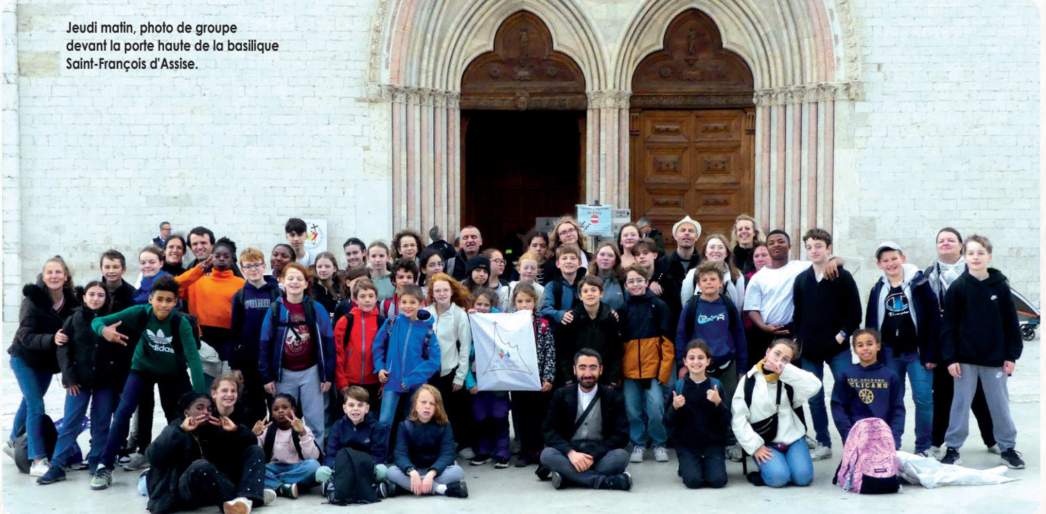
Jeudi matin, photo de groupe devant la porte haute de la basilique Saint-François d'Assise.

Après un long voyage de quinze heures en bus, l'arrivée à Rome, en fin d'après-midi, a marqué le début d'une expérience unique, teintée de fatigue mais aussi d'une immense excitation. Après une petite marche avec nos valises, nous sommes enfin arrivés à notre hébergement. Loin du confort de nos maisons, l'hébergement simple et fonctionnel, au style minimaliste, a offert un cadre authentique qui a renforcé l'esprit du pèlerinage. Bien que certains aient dû se contenter de douches froides, ces petits défis n'ont en rien entamé l'enthousiasme du groupe.