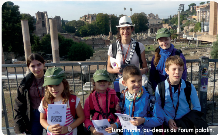
Lundi matin, au-dessus du Forum palatin.

dans nos mémoires comme un moment de grâce pure. Après avoir franchi la porte sainte de la basilique Saint-Pierre nous avons pris part à la procession qui nous a conduits à la découverte des autres merveilles du Vatican, suivie d'une visite exceptionnelle de la Rome baroque.